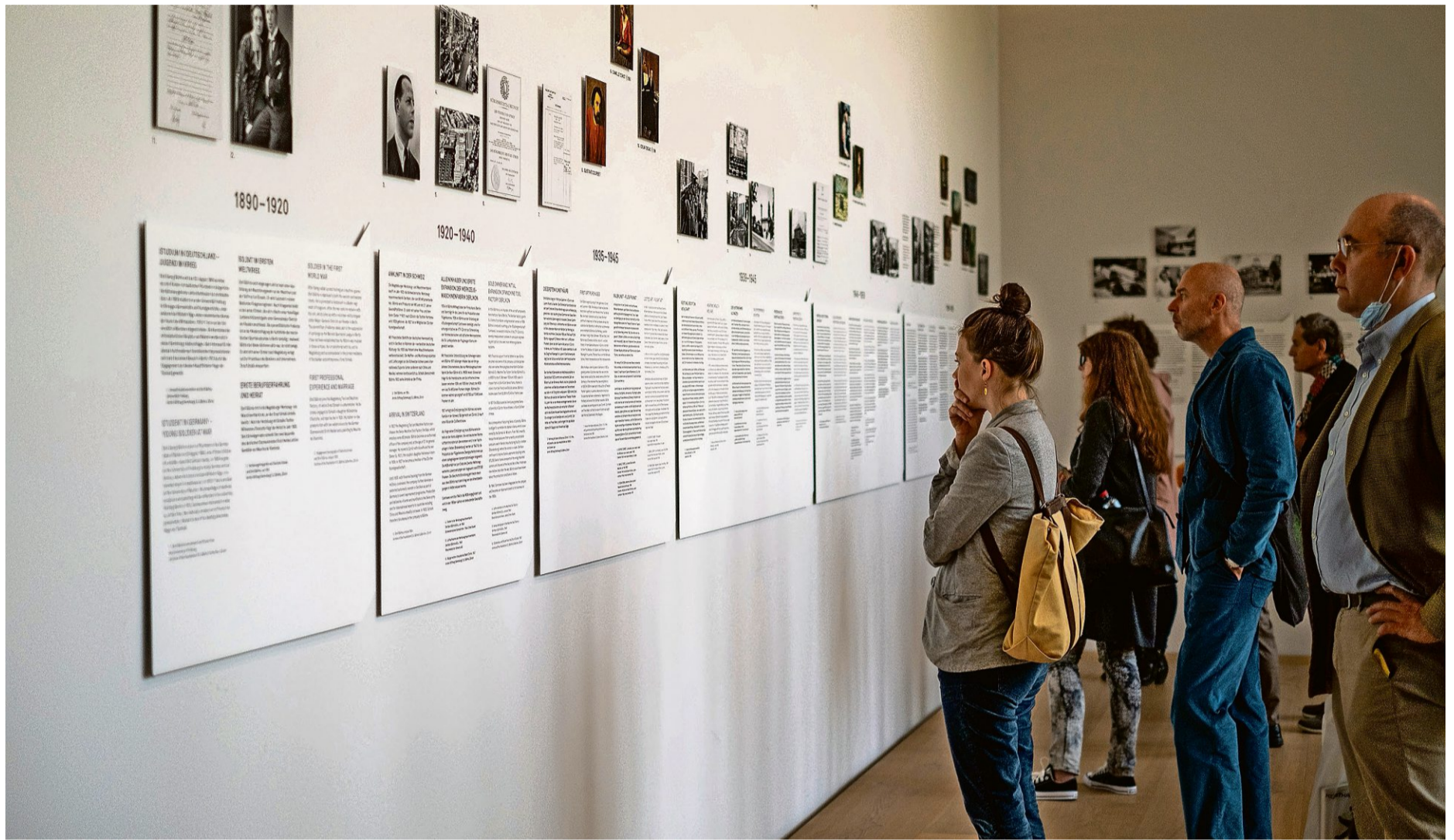
Dokumentationsraum zur Sammlung des Waffenhändlers Emil Bührle: Es gibt Formulierungen, die als Beschönigungen empfunden werden können.

Zusätzliche Freiheit, aber auch Verantwortung erhält die Kunstgesellschaft bei der Darstellung des historischen Kontextes: Mit dem alten Vertrag hatte die Bührle-Stiftung auch hier ein Vetorecht. Davon – wie auch von dem Recht, die Aufschrift «Sammlung Emil Bührle» an der Fassade des Kunsthaus-Erweiterungsbaus anzubringen – habe die Stiftung nie Gebrauch gemacht, teilt sie auf Anfrage mit. Und dies, ob-